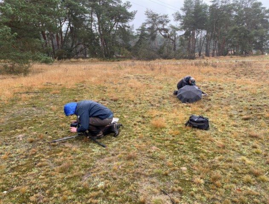
Fotograferen van het stuifzandkorrelloof is niet altijd even eenvoudig...