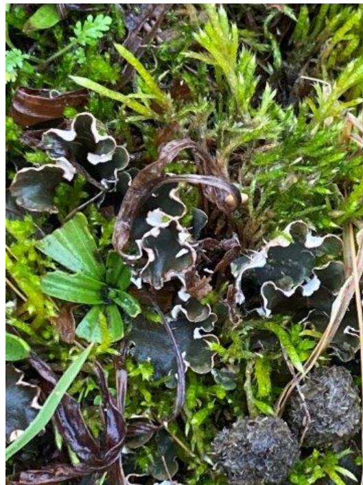
Zwart leer mos